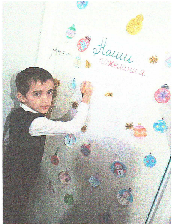
Пожелание от всех детей с наступающим Новым годом!